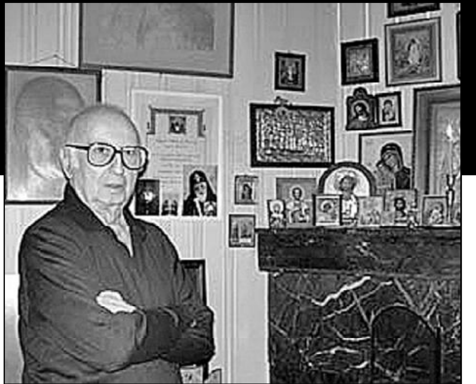
საქართველოს მეცნიერებათა ეროვნული აკადემია ღრმა მწუხარებით იუწყება, რომ მწ წლისა გარდაიცვალა გამოჩენილი პოეტი და საზოგადო მოღვაწე, რუსთაველის, გა- ლაკტიონ ტაბიძისა და საერთაშორისო ლიტერატურული პრემიების ლაურეატი