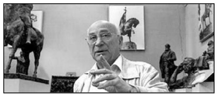
საქართველოს მეცნიერებათა ეროვნული აკადემია და ენის, ლიტერატურისა და ხელოვნების განყოფილება ღრმა მწუხარებით იუწყებიან, რომ გარდაიცვალა სახელოვანი ქართველი მოქანდაკე, საქართველოს სახალხო მხატვარი, საქართველოს მეცნიერებათა ეროვნული აკადემიის აკადემიკოსი