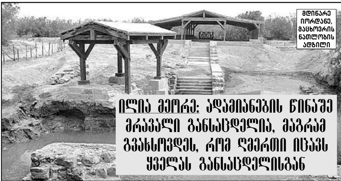
მდინარე იორღანა, მასხოვრის ნათლოვის აღბილი

ილია გორგიჯანიანი: აღამიანების წინაშე გრაჰული განსასდელია, მბგრამ გვასსოვდეს, რომ ღმერთი იცავს ყველას ამ განსაცდელისგან, – აღნიშნა პატრიარქმა.