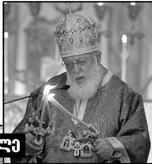
ვაზირარქის სააღვომო ეპისტოლა

ურთულესი ვითარებიდან უფალს მრავალჯერ დაუსხნია კაცობრიობა