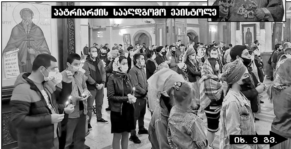
იხ. 3 გვ.

რაც არ უნდა ბინძური კამპანია აგიგოროთ, მა მაინც ბოლოვდა ვიღვანებ საქართველოს კეთილდღეობისთვის!