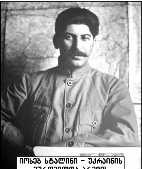
იოსებ სტალინი - უკრაინის მშრომელთა არმიის საბჭოს თავმჯდომარე. 1920 წ.

რუსეთმა 1922 წელს არასტაბილური, არამყარი მთავრობით შეაბიჯა. ქვეყანა ძირითადად საომარი მდგომარეობის პირობებში იმართებოდა, რადგან კვლავ მძვინვარებდა სამოქალაქო ომი, ხოლო ვოლგისპირეთი საშინელ შიმშილს მოეცვა. გარდა ამისა, ქვეყანა, რომლის ნაწილი ოკუპირებული იყო უცხოელი ინტერვენტების მიერ, საერთაშორისო იზოლაციაში იმყოფებოდა, მაგრამ წლის ბოლოს, ბოლშევიკებმა ზეიმით აღნიშნეს 1917 წლის გადატრიალ-