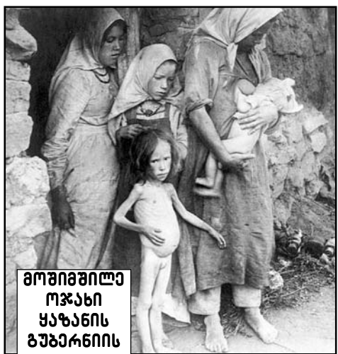
მოშინილი ოჯახი ყაზანის ბუბარინის ერთ-ერთ სოფელში. 1921 წ.