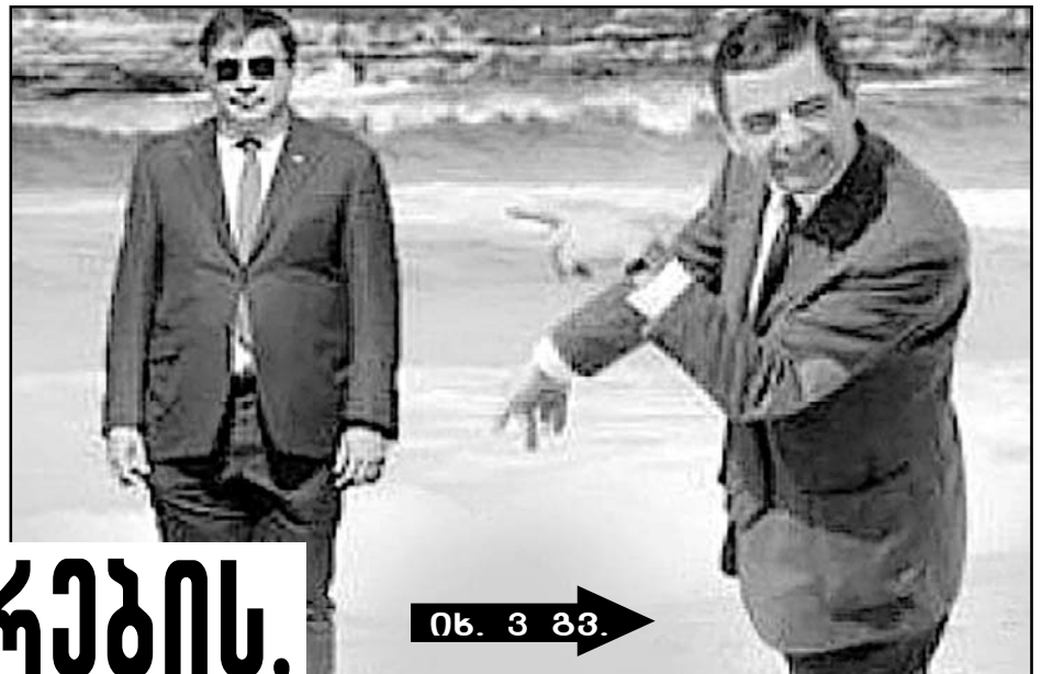
იხ. 3 გვ.

ოპოზიცია ისე გაკობრდა, ხალხი აბუჩად იბდებს და დასცინის, სააკაშვილი კი საცოდავ პერსონად იქცა