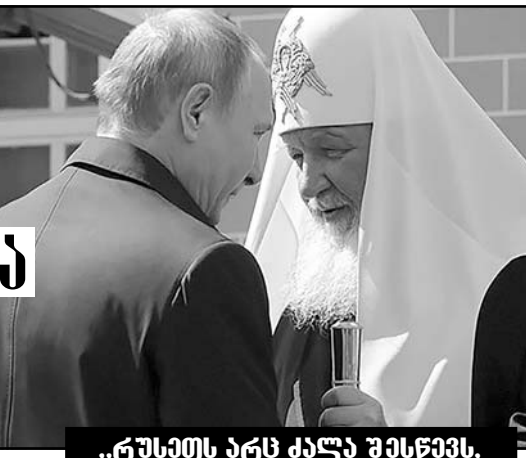
„რუსეთს არს კალა შესწავს, არს კულტურული განვითარება, რომ „მისამე რომი“ იყოს...“

მოყალიბდა, რაოდენ განსაკვირვებელი იყო, იშვიათი გამოვლინება იყო სხვათა მინა-წყალი. აზნაურობა კამანის დავითის შემდეგ, კამანის ეპისკოპოსთან მდგომარეობა რუს დავითის გიჟებს შორის გამოირჩეოდა ერთი მხრივ მართლმადიდებლობის სახელმწიფო ალტერნატივა. რუსთა გან დანახვა, როგორც უფრო მეტი დავითის ტყვეობა, მივიდა რაზმის მითაუბრთან და უთხრა, „თუ ამ ხალხის წამებას არ შეწყვეტით, ჩვენ, რუსის ჯარისკაცები, დავმართებთ იარაღს“.