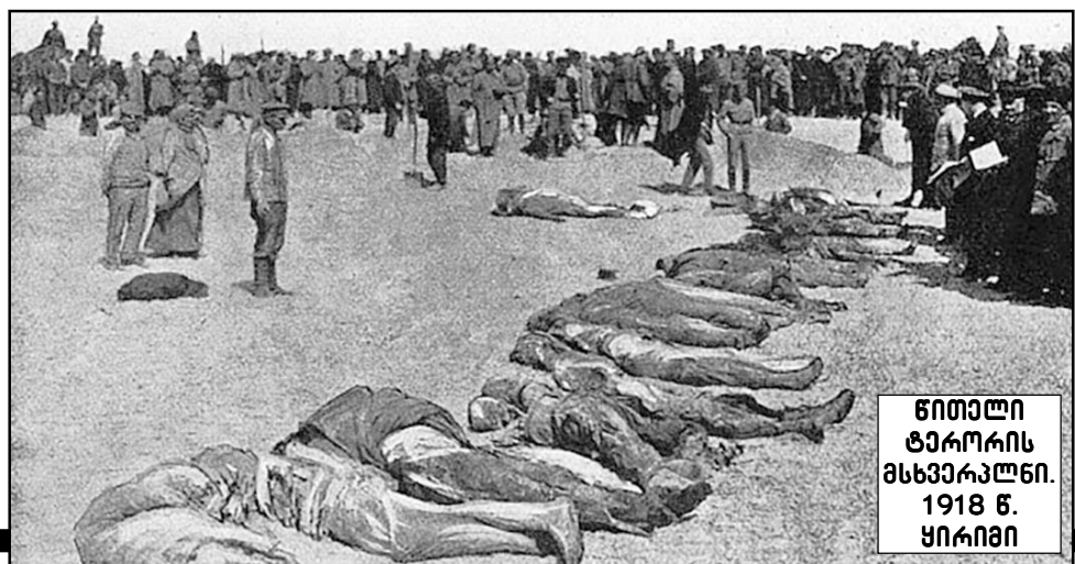
წითელი ტერორის მსხვერპლები. 1918 წ. ყირიმი

1918 წელს ლენინმა სტალინი გაგზავნა სამხრეთის ქალაქ ცარიცინში (რომელსაც მოგვიანებით სტალინგრადი ეწოდა, ახლა კი ვოლგოგრადი ჰქვია) სასაურსათო პროდუქტის რეკვიზიციისთვის ბრძანებით: „იყავი უმონყალო“.