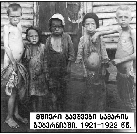
მშვიდი ბავშვები სამარის ბუბარინაში. 1921-1922 წწ.

„დარწმუნებული იყავით, რომ ხელი არ აგვიკანკალდება, — უპასუხა სტალინმა, — არავის მიმართ არ გამოვავლენთ გულმონწყალებას“.