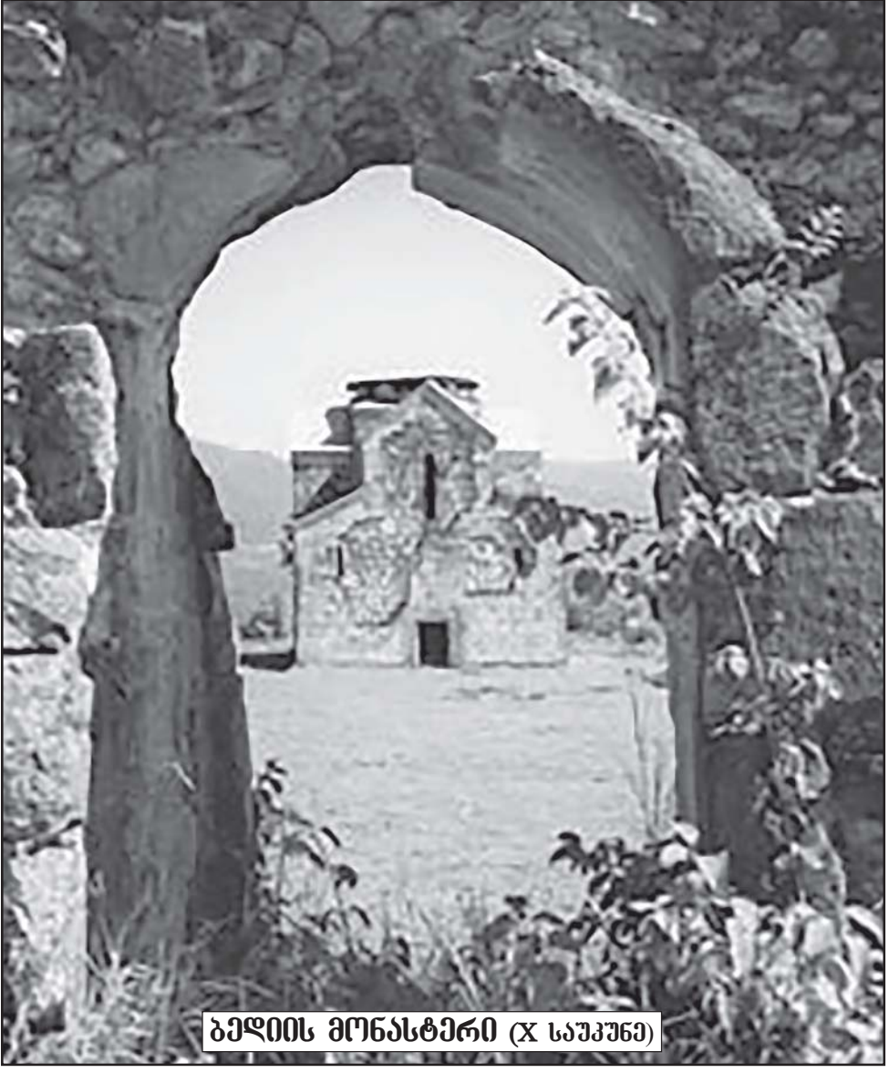
ბედიის მონასტერი (X საუკუნე)

მიას განთავისუფლება მოითხოვეს. ამასთან დაკავშირებით მკაფიოდ გვსურს, განვაცხადოთ, რომ კანდიდატის სტატუსის საპირფარეო პირობა ვერც ტრადიციულ ღირებულებებზე უარის თქმა იქნება, ვერც კანონის უზენაესობის დათმობა და ვერც კრიმინალურობის ხელისუფლების იძულებით გადაგარება. ხელისუფლება ყველაფერს აკეთებს კანდიდატის სტატუსის მისაღებად, რისთვისაც ევროკომისიის მიერ განსაზღვრული 12 პუნქტიც ზედმიწევნით სრულდება, თუმცა მიგვაჩნია, რომ როდესაც საქართველოს ევროპულ ინტეგრაციასა და საუბარს, ჩვენც უნდა გვქონდეს ჩვენი პირობები და ეს პირობები სწორედ ქართული საზოგადოების ტრადიციულ ფასეულობებს, სახელმწიფო სუვერენიტეტს უნდა დავეკავშიროთ. შესაბამისად, საზოგადოებასთან ერთად უნდა დავიწყოთ მსჯელობა იმის დასაზუსტებლად, რა პირობების დასვას ვითხოვთ ევროკავშირისგან საქართველოს ევროპული ინტეგრაციის გზაზე. ამ პირობებს თუ არ დავაყენებთ, ვერც სუვერენიტეტს დავიყავთ, ვერც ტრადიციულ ფასეულობებს და ვერც მშვიდობას ჩვენს ქვეყანაში!..