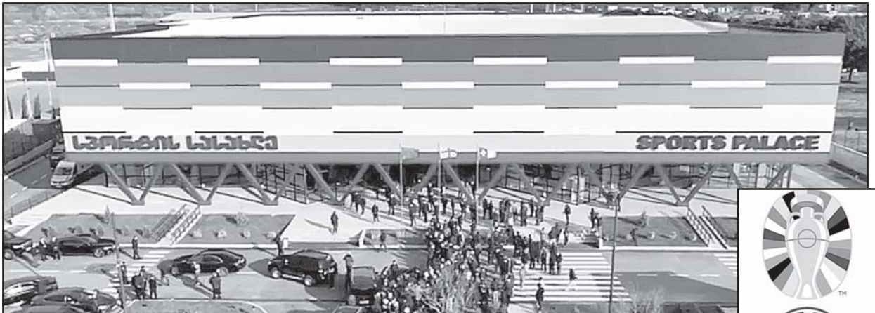
დღეს საქართველო-ლუქსემბურგის საფეხბურთო მატჩს დაენსრება, სადას სარეპიონო ქამარს წარადგენს.