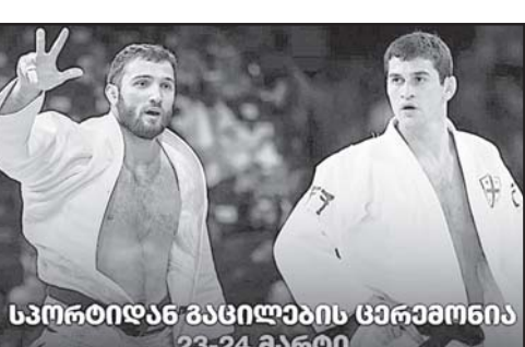
სპორტიდან გასილუბის ცარკომია 23-24 მარტი